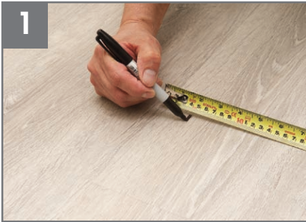
1 Mida 1 ½" (3.81 cm) dentro del perímetro de la tabla dañada y marque.