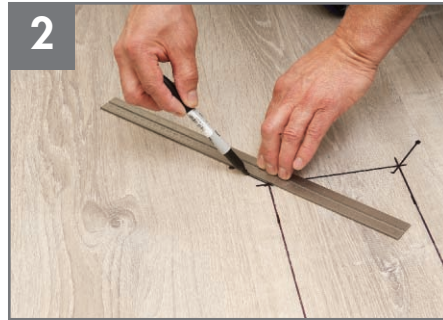
2 Marque los puntos de detención diagonales en las cuatro esquinas de la tabla dañada.