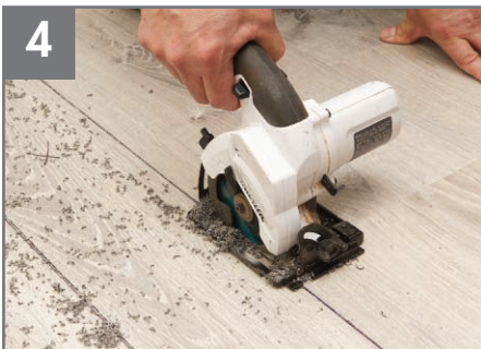
4 Corte cuidadosamente a lo largo de las marcas del perímetro que hizo. Aspire los desechos.