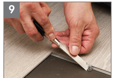
9 Quite la traba de los bordes largos y cortos del material circundante con un cíncel pequeño. Aspire los desechos.