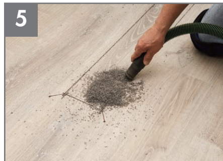
5 Aspire los desechos.