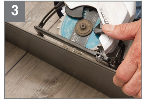
3 Utilice una tabla como medidor para colocar la hoja de sierra a la profundidad adecuada para evitar cortar el contrapiso.