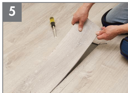
5 Quite la sección central al utilizar un cíncel pequeño para levantar el primer borde.