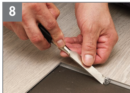
8 Quite la traba de los bordes largos y cortos del material circundante con un cíncel pequeño. Aspire los desechos.