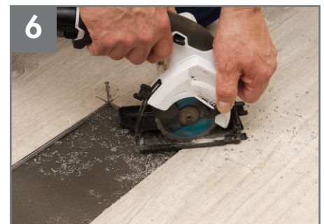
6 Corte cuidadosamente las diagonales. Aspire los desechos.