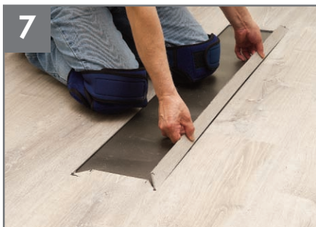
7 Quite las tiras restantes de material de los bordes largos y cortos.