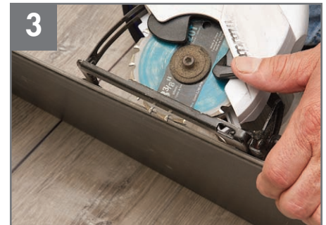
3 Utilice una tabla como medidor para colocar la hoja de sierra a la profundidad adecuada para evitar cortar el contrapiso.