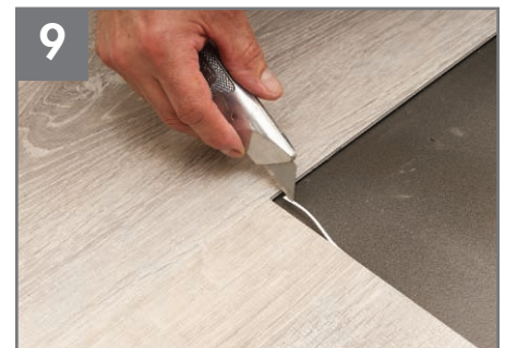
9 Quite la tira de fijación Unifit™ expuesta del piso.